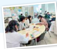
◀ハロウィンDE心理テスト