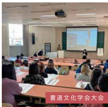
書道文化学会大会