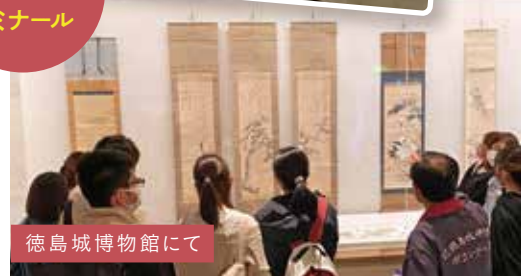
徳島城博物館にて