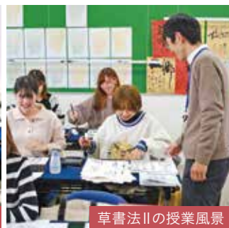
草書法Ⅱの授業風景