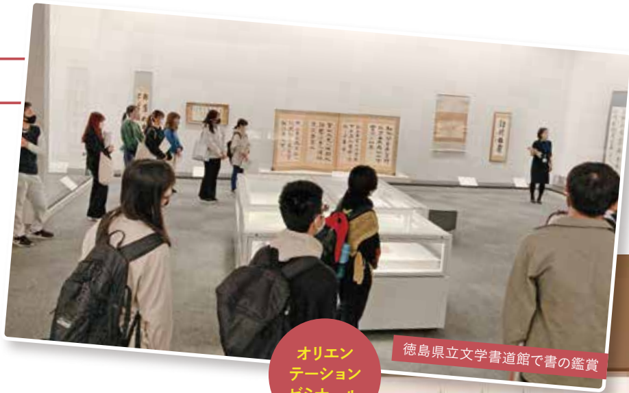
オリエンテーションゼミナール