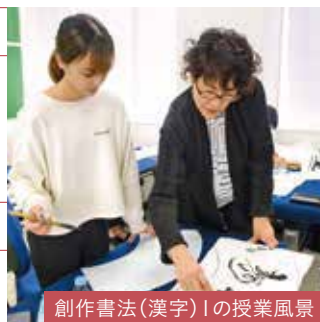
創作書法(漢字)Ⅰの授業風景

漢字、仮名、漢字仮名交じりの書、篆刻など書道全般にわたる実技科目が充実。書道の技術の本格的な向上を支援します。また、現代社会の中で生きる実用書道・デザイン書道・アート書道など、新しい書の新分野を開拓します。